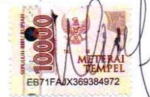
Sawitri Hyang Sumiwi