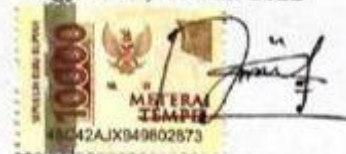
Dewi Indah Yati