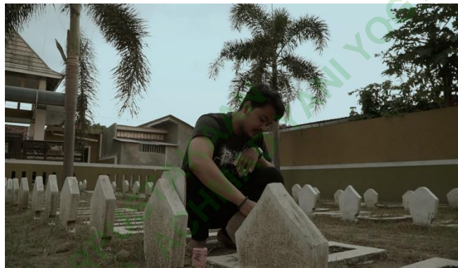
Gambar 4.4 bagian Akhir dari Film ASA

Pada saat pengambilan gambar, komposisi merupakan hal penting dan bagian sederhana untuk mengatur elemen – elemen yang ada dalam gambar, sehingga mampu menyampaikan perasaan yang diinginkan dalam mengekspresikan, karena gambar yang dihasilkan harus memiliki tujuan untuk menyampaikan pesan melalui talent atau pemain, bertujuan untuk mendapatkan adegan yang diinginkan. Variasi shot juga digunakan dalam perekaman film pendek ini diantaranya adalah Extreme Long Shot , Long Shot , Medium Shot , Medium Close Up , Close Up . Untuk pergerakan kamera menggunakan Panning , Tilting dan Zooming . Sedangkan untuk sudut pengambilan gambar yang digunakan Eye Level , Low Angel dan High Angel