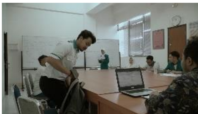
Gambar 4.2 Pengantar Awal Film Pendek ASA

Sistem perekaman film pendek ini dilakukan secara langsung ( direct ) dan bersamaan baik dari unsur audio maupun visual. Selain itu crew juga menggunakan sistem rekaman tidak langsung ( undirect ) untuk unsur audio yang diantaranya meliputi narasi, sound effect dan ilustrasi musik. Pengambilan gambar hanya merekam adegan yang sesuai dengan arahan dan sesuai konteks dalam film pendek.