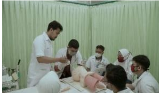
Gambar 4.3 Bagian utama dari Film Pendek ASA