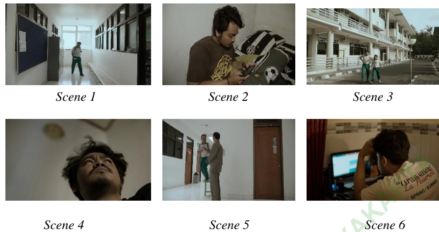
Gambar 4.5 Tipe Shot Gambar

Tipe Shot digunakan sebagai penekanan pada suatu cerita. Seperti gambar di atas: Scene 5 (Close Up) di gunakan sebagai memperjelas subjek. Sedangkan Scene 1 (Extreme Close Up) pengambilan yang sangat dekat dengan objek, sehingga terlihat jelas dan menampilkan detail dan ekspresi. Scene 3 ( Long Shot) untuk pengambilan gambar dan memberi ruang pada background, sehingga mampu menceritakan kondisi sekitar yang ada di daerah sekitarnya, seperti penggambaran lokasi kampus yang terlihat pada Scene 3 .