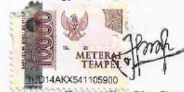
Pramudita Sita Devi