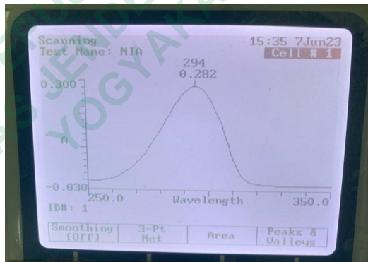
Gambar 5. Panjang Gelombang Maksimum Hidrokuinon

Scanning panjang gelombang maksimum dilakukan pada 250-350 nm menggunakan detector UV dan diperoleh panjang gelombang maksimum hidrokuinon adalah 294 nm dengan nilai absorbansi 0,282. Panjang gelombang tersebut dapat dilihat pada Gambar 5 .