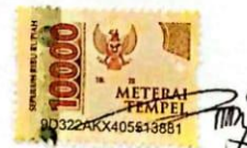
Afifah Nur 'Aini