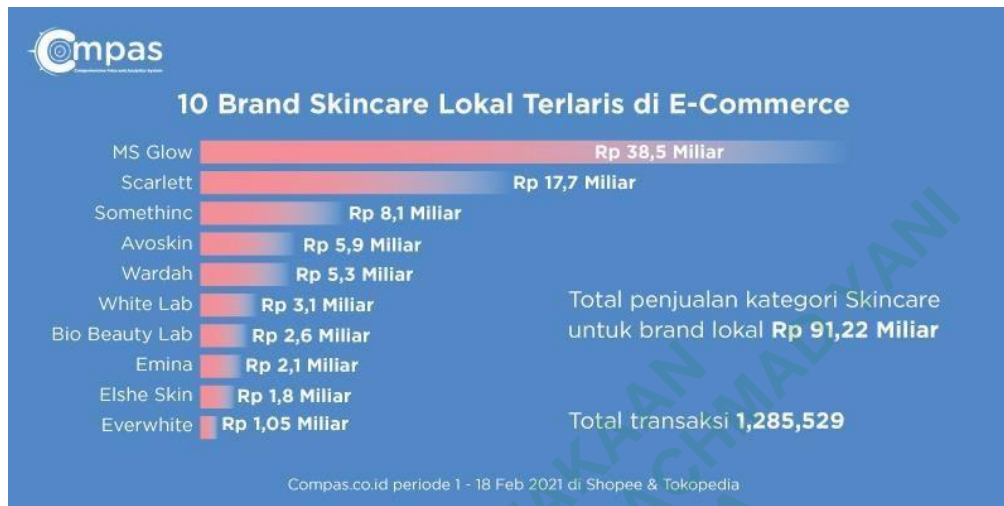
Gambar 2 Brand Skincare Terlaris 2021

Retinol Toner 100ml dan Miraculous Refining Serum . (indonewstoday, 2023).