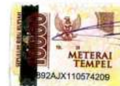
Dian Islamiati Yusuf