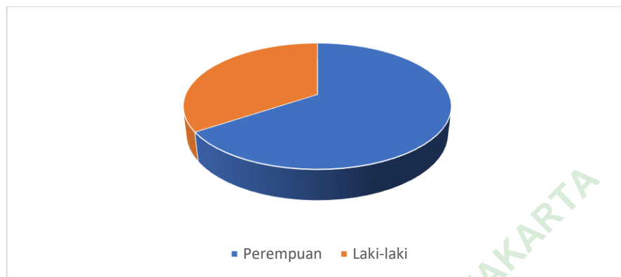
Gambar 3. Sebaran Data Jenis Kelamin

Berdasarkan gambar 3 diketahui bahwa dari 128 subjek terdapat 44 subjek (34,4%) yang berjenis kelamin laki-laki dan 84 subjek (65,6%) berjenis kelamin perempuan. Hasil tersebut menunjukkan bahwa subjek yang berjenis kelamin perempuan lebih banyak daripada subjek yang berjenis kelamin laki-laki.