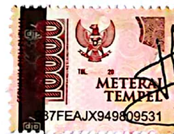
Yusuf Chamdan muttachid