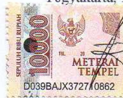
Ami Soega Dwigantina