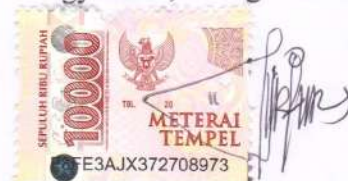
Ananda Tunjung Pertiwi