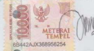
Siti Nur Afifah