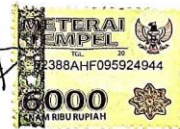
Kus Indah Nurmala Dewi