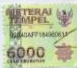
Diah Puspita Dewi