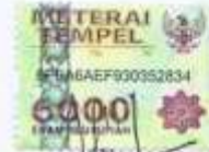
Desi Ambar Wati