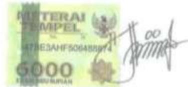
Shinta Firqotin Najaa