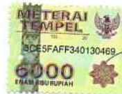
Gita Amalia Puspita