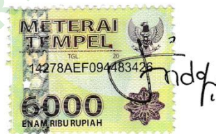
Firda Aloe Vera