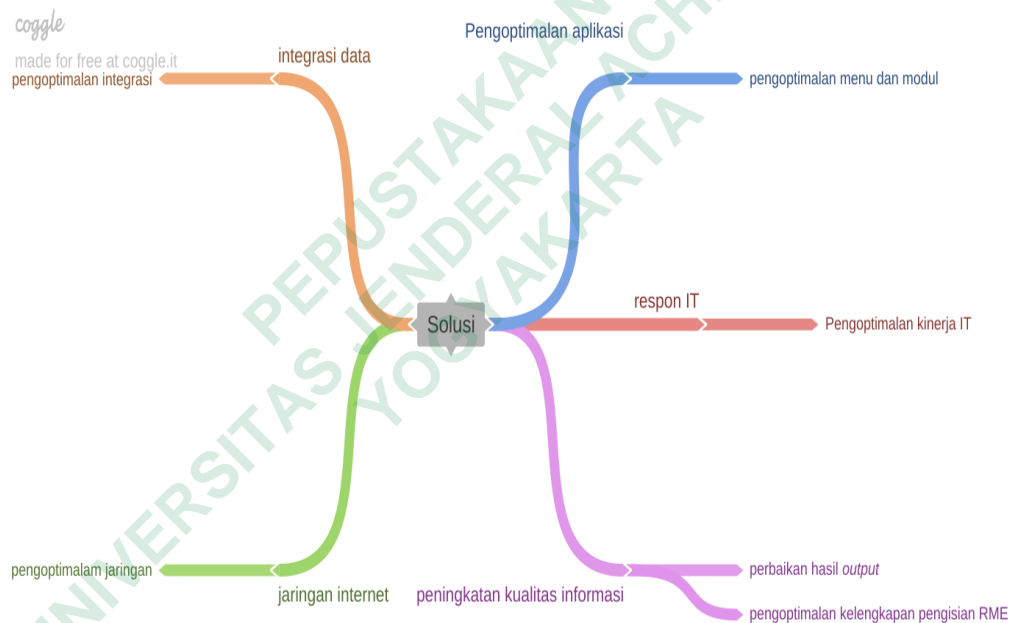
Gambar 4. 2 Penyajian Data Solusi RME

Setelah ditentukannya sub kategori (koding), kategori, dan tema terkait jawaban informan mengenai solusi pada RME, kemudian peneliti melakukan penyajian data menggunakan mind mapping .