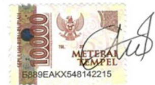
Azizah Nur Aeny