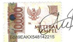
Azizah Nur Aeny