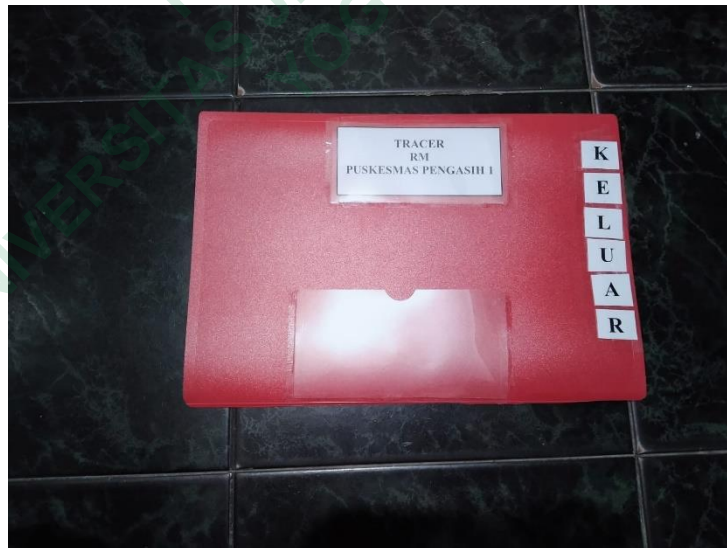
Gambar 4.2 hasil perancangan tracer

Berdasarkan hasil penelitian maka peneliti akan mencoba tracer tersebut di bagian ruang filing yang telah dibuat oleh peneliti, tracer tersebut nantinya di masuk ke dalam bagian rak filing yang berupa kayu. Hal tersebut diterapkan agar memudahkan petugas dalam pencarian berkas dan proses pengembalian berkas rekam medis. Berikut merupakan tempat ruang filing yang ada di Puskesmas Pengasih 1.