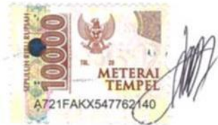
Faiz Ahnaf Pramono