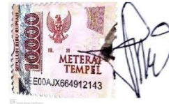
(Resita Elva Mafazi)