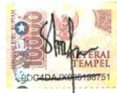
Sinta Eva Ningrum