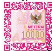
Metro Jaya, S. Kep