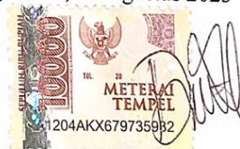
Dhealita Dwi Pertiwi