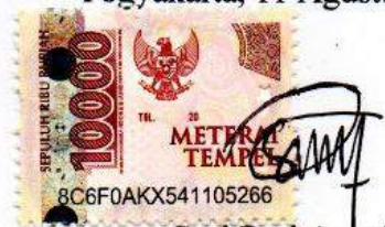
Suri Dwi Astuti