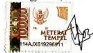
Woro Sekar Arum