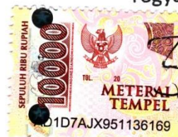
Endah Nur Rahmah