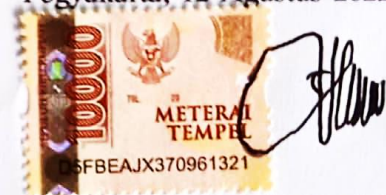
Windi Aulia Pratiwi