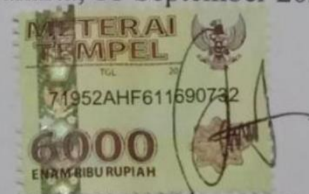
Benedicta Helga Yulita