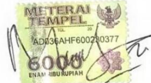
Nehemia Ade Fitri