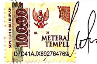
Intan Dewi Astuti