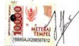
Bella Maulia Saputri