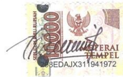
Kurnia Ageng Firdaus