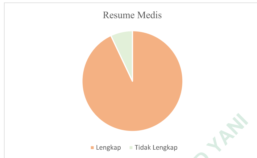
Gambar 4.4 Distribusi Kelengkapan Pendokumentasian Yang Benar

Berdasarkan tabel 4.3 hasil analisis data pendokumentasian yang benar pada resume medis rawat inap di PKU Muhammadiyah Nanggulan, dilaksanakan dengan cara meneliti lengkap dan tidak lengkap pengisian pendokumentasian yang benar pada resume medis rawat inap. Dari hasil gambar 4.4 diketahui bahwa dari semua komponen analisis, resume medis lengkap sebanyak 70 atau 93% dan tidak lengkap 5 atau 7%. Berdasarkan wawancara faktor dari ketidaklengkapan pada komponen pendokumentasian yang benar karena kurangnya ketelitian dokter dan petugas rekam medis dalam mengisi jenis kelamin, diagnosa, nama dokter, tanda tangan pada lembar resume medis sehingga terdapat bagian yang masih kosong.