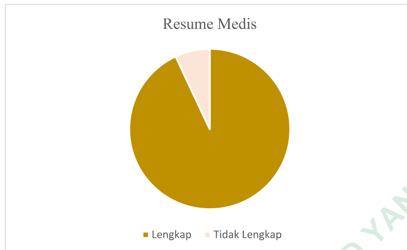
Gambar 4.3 Distribusi Kelengkapan Autentifikasi

Berdasarkan tabel 4.3 hasil analisis data autentifikasi pada resume medis rawat inap di PKU Muhammadiyah Nanggulan, dilaksanakan dengan cara meneliti lengkap dan tidak lengkap pengisian autentifikasi pada resume medis rawat inap. Dari hasil gambar 4.3 diketahui bahwa dari semua komponen analisis, resume medis lengkap sebanyak 70 atau 93% dan tidak lengkap 5 atau 7%. Berdasarkan wawancara faktor dari ketidaklengkapan pada komponen nama dokter dan tanda tangan karena kurangnya tingkat kesadaran dan kedisiplinan dokter dalam melengkapi rekam medis menyebabkan dokter tidak segera menandatangani dokumen rekam medis.