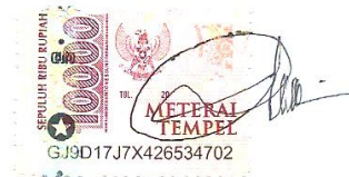
Ike Fitria Aidina