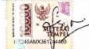
Firda Sopiyaatul Wahdah