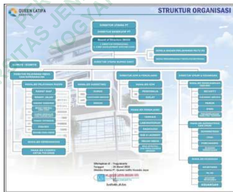
Gambar 4. 1 Struktur Organisasi

Rekam medis berada di bawah koordinasi Kepala Unit Rekam Medis, yang bertanggung jawab langsung dalam pengelolaan, pengawasan,