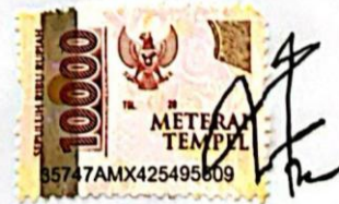
Aisyah Tri Anggraini