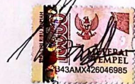
Luthfi Dwi Nugraha