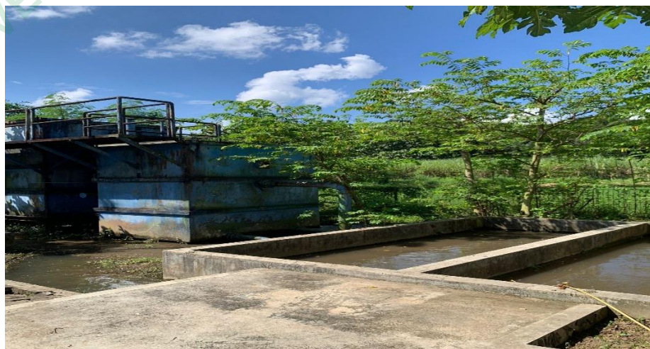
Gambar 4.5 Bak Penampung Lumpur