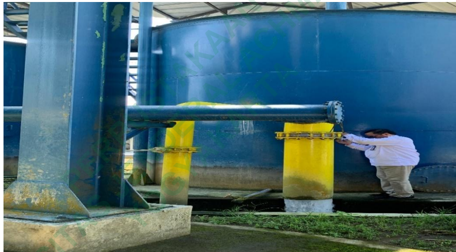
Gambar 4.4 Pipa Pembuangan Filtrasi