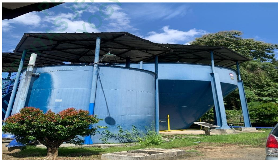
Gambar 4.2 Bak Sedimentasi Dan Filtrasi

Berdasarkan hasil diatas, pada bagian identifikasi pengelolaan sumber daya air, perusahaan telah melakukan identifikasi terkait pengelolaan dan pemeliharaan sampai dengan pembiayaannya. Adapun proses yang dilakukan perusahaan adalah sebagai berikut: