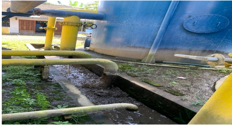
Gambar 4.3 Pipa Pembuangan Sedimentasi