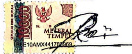
Riki Dwi Saputra