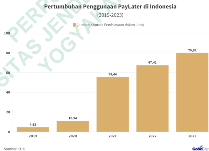
Gambar 1. 1 Grafik Pengguna Layanan Paylater

Finance dalam aplikasi Shopee, yang memungkinkan pengguna untuk memperoleh produk dengan fleksibilitas pembayaran yang ditangguhkan atau opsi cicilan tanpa memerlukan kartu kredit (Shopee, 2025). Shopee Paylater menawarkan kemudahan akses, proses aktivasi yang sederhana, cicilan 0%, serta diskon 100% untuk pembelian pertama menggunakan Shopee Paylater (Shopee, 2025). Menurut survei Populix, Shopee PayLater menjadi layanan paylater paling populer di Indonesia dan menduduki top of mind sebanyak 89% responden, serta digunakan oleh 77% pengguna paylater secara aktif (Rini, 2023). Survei ini juga menunjukkan bahwa Shopee Paylater mengungguli penyedia layanan lainnya seperti GoPayLater dan Akulaku . Selain itu, Otoritas Jasa Keuangan (OJK) mencatat adanya pertumbuhan signifikan dalam penggunaan layanan paylater secara nasional, yakni sebesar 33,25% year on year (yoy) dari 54,7 juta menjadi 72,88 juta kontrak per Mei 2023 (Rini, 2023). Berikut ini adalah grafik perkembangan pengguna Paylater di Indonesia: