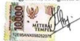
Putri Nur Aini