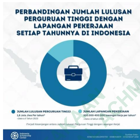
Gambar 1. 2 Perbandingan Jumlah Lulusan Perguruan Tinggi dengan Lapangan Pekerjaan Setiap Tahunnya di Indonesia

Situasi ini menunjukkan bahwa mahasiswa tingkat akhir diharapkan memiliki dasar sebuah keterampilan yang kuat agar mudah terserap dalam pasar kerja yang memiliki persaingan semakin kompetitif (Pertiwi & Linando, 2024).