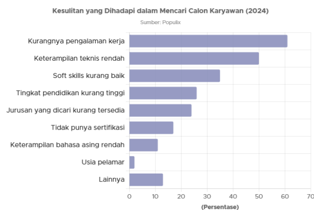
Gambar 1. 3 Presentase Kesulitan yang Dihadapi dalam Mencari Calon Karyawan

Menurut data goodstats tentang kesulitan yang dihadapi dalam mencari calon karyawan pada tabel berikut ini: