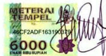
Eka Putri Puspita