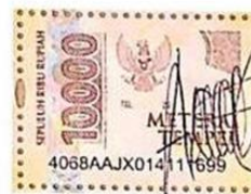
Agnes Anastasia Wulandari