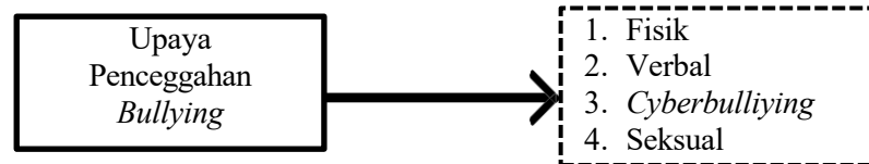
Gambar 2. 2 Kerangka Konsep